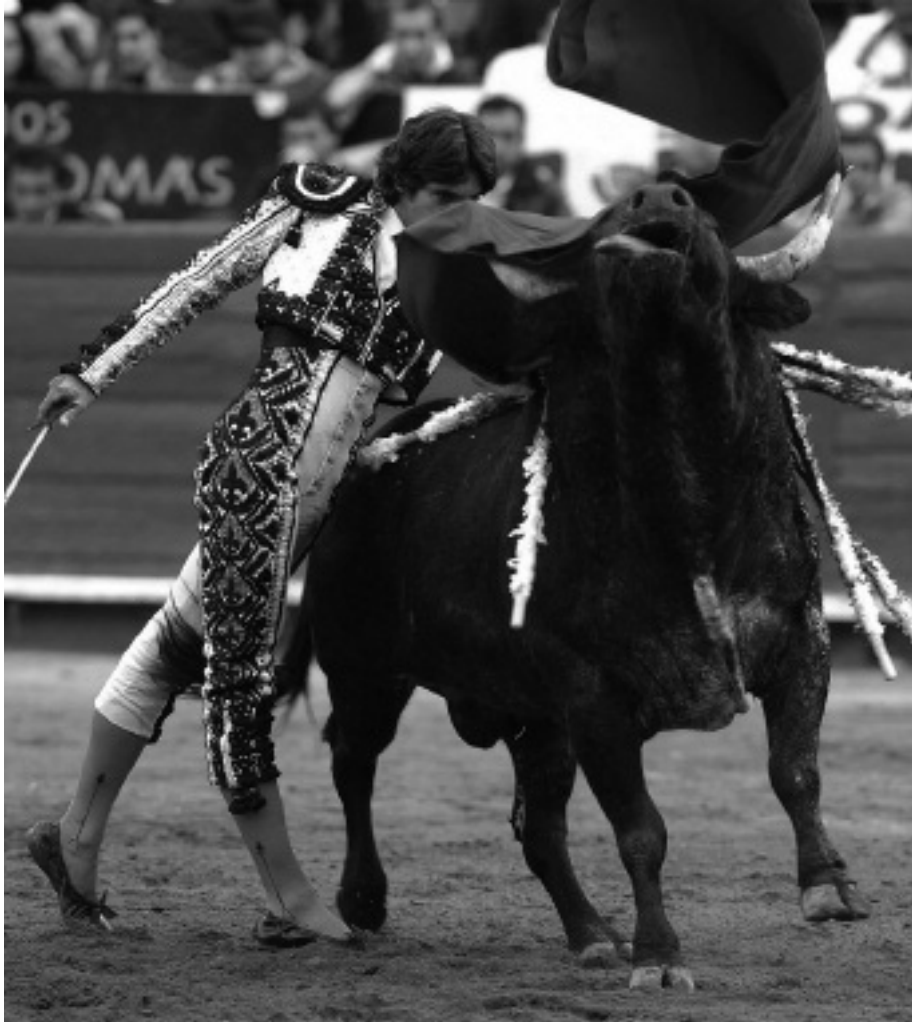
Pase de pecho, a muleta munka megkoronázása. Castella a bika fejét szorosan és lassan a mellkasa előtt vezeti el, a felsőtest bedöntése vagy kifordítása nélkül, ahogyan kell.