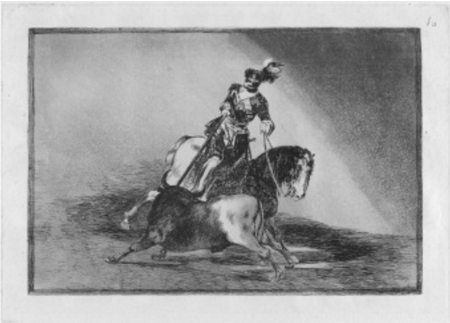
Francisco Goya La Tauromaquia sorozatának egyik darabja. Carlos V. lanceando un toro en la plaza de Valladolid. Habsburg Károly német-római császár és spanyol király a valladolidi bikaringben lóhátról lándzsát döf egy harci bika öklelő izmába. A jelenet a XVI. század első felében játszódhat.