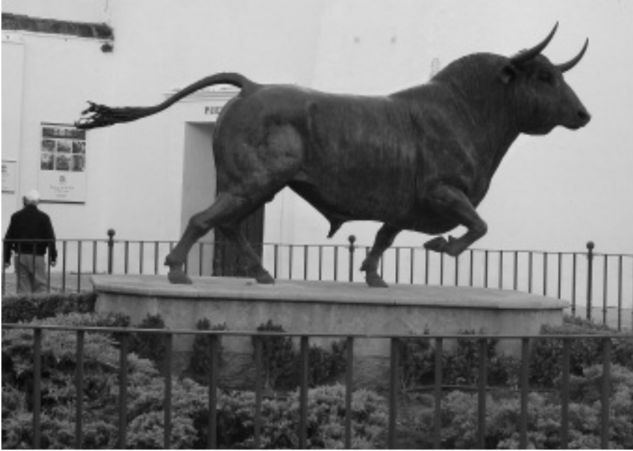
Toro de lidiát, vagyis harci bikát ábrázoló bronzszobor a rondai plaza előtt. Az ideális harci bikának nagy feje van, széles, tűhegyes szarvai, nyakán erős izomcsomó, amit ki kell fárasztani a viadal során.