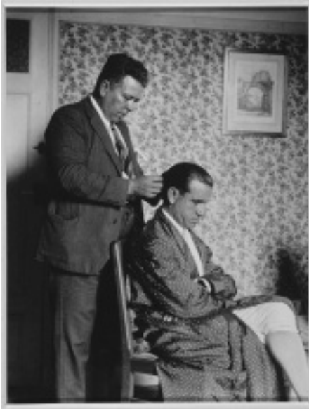
Juan Belmonte az 1930-as években. Kardbordozója éppen a coletát, a torerók kasztjához tartozást jelentő varkocsot készíti