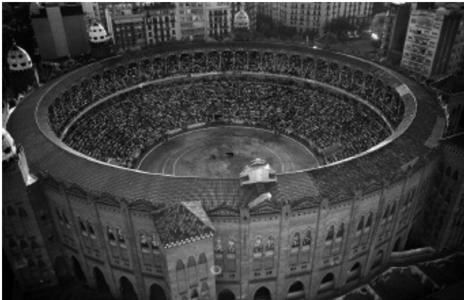
A barcelonai La Monumental, amelyben 2012 januárja óta nem rendeznek bikaviadalokat.