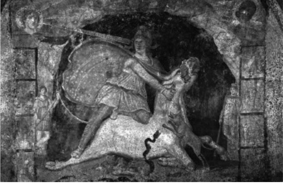
Mithrász csillagos köpenyben. Az olaszországi Marinóban feltárt szentély freskója. I. u. 2. század.