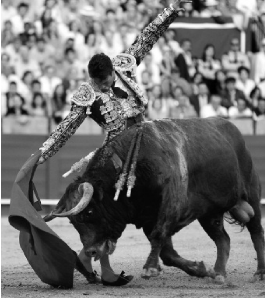
Manzanares jellegzetes „légcsvár” mutatványa. Impozáns, de nem szabályos derechazo. A jobbkezes elvezetésnél a bal kezét csípőre kell tenni, de legalábbis lent tartani.