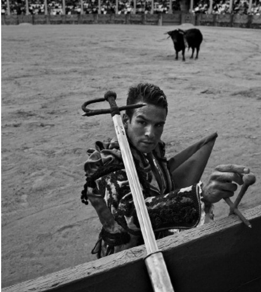
A faena végén a matador magához veszi az ölkardot.