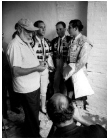
Ernest Hemingway az ötvenes évek két vezető matadorával, Luis Miguel Dominguínnal (feketével kivarrott fehér öltönyben) és Antonio Ordoñezzel (karjára terített köpennyel). Az ő vetélkedésükről szól az író utolsó munkája, a Veszélyes nyár című dokumentumregény.