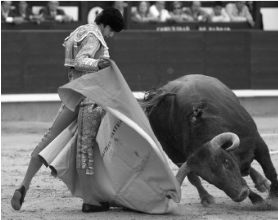
A bikaviadal kezdete, tesztelés a köpennyel. Castilla verónicája – kötelező gyakorlat, jobb és bal oldalon is meg kell ismételni.

Már vége. Mi történik? Ó, nézzetek a testre: halál kente be kénnel, a fejét kicserélte fekete bikafejre: minotaurusz-fejre!”