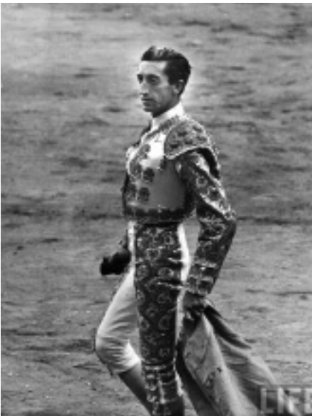
Manuel Rodríguez „Manolete” röviddel halála előtt, a San Fermin Fesztiválon való fellépésén.