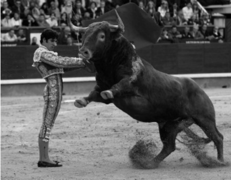
Klasszikus manoletina Alejandro Talavante előadásában. Két kézzel végzik és a bika nagyon távol van az embertől. Korábban a nyakizom fáradtságát tesztelték vele, manapság dekorációs célt szolgál.