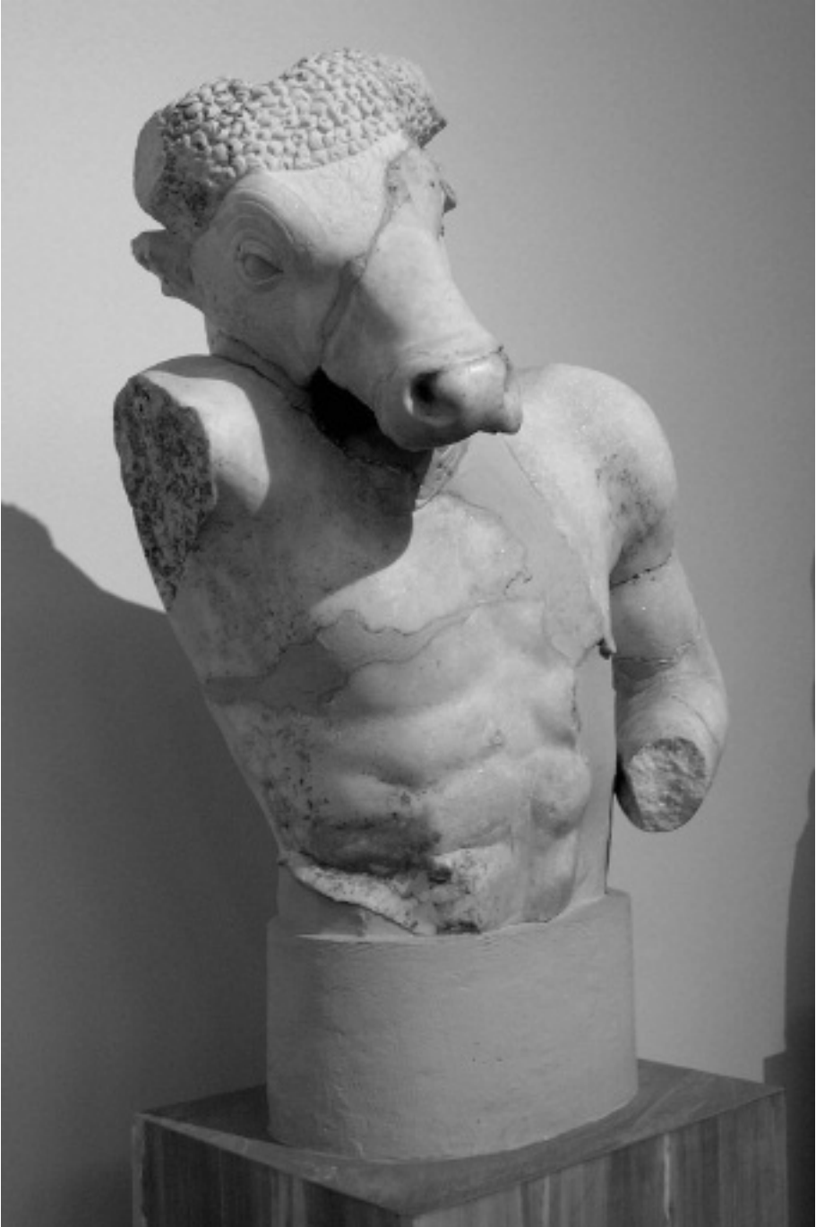
Mürön Minótaurosza a Thészeusz és Minótauroszt elveszett szoborcsoportjából. I. e. 5. század.