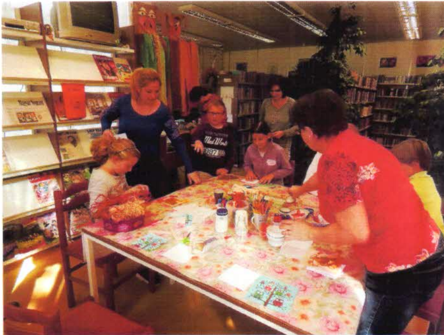
Őszi képek születőben.