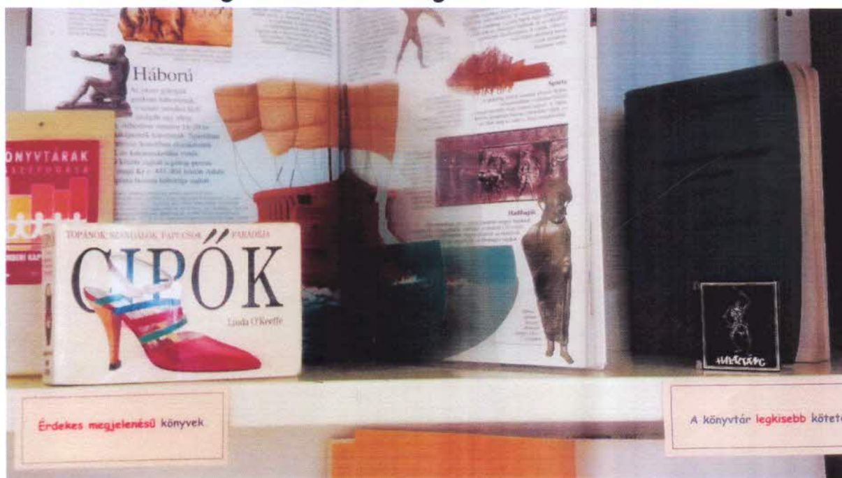
Képek a kiállításról

Feledékeny olvasók több tárgyat is a kikölcsönzött könyvben hagytak. Ennek egy részét is bemutattuk. Olyan tárgyakat, amelyeknek nem lett meg a gazdája: könyvjelzők sokasága, régi fényképek, képeslapok és mindenféle egyéb tárgy, amit könyvjelzőként lehet használni. 139 látogató szemlélte meg kis kiállításunkat.