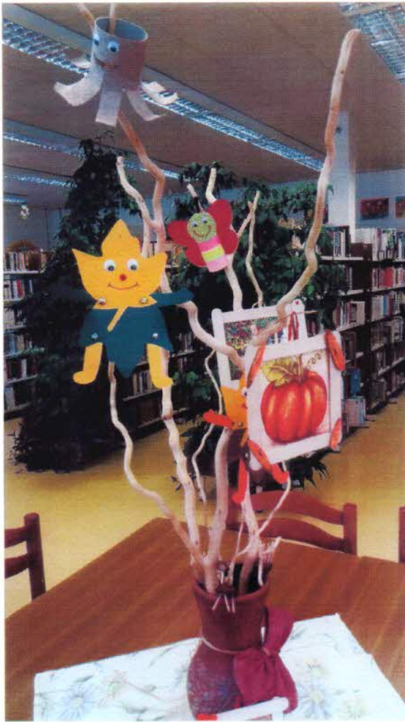
Az elkészült művek.