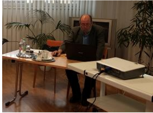
és a szakértő

Kollégák a Vas megyei városi könyvtárakból: