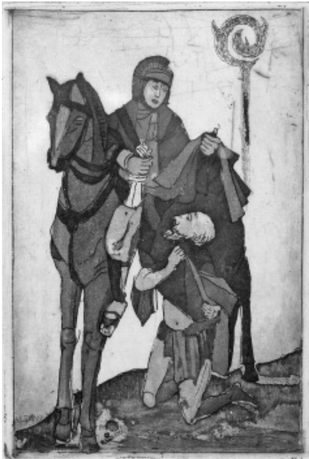
Kamper Lajos: Szent Márton és a koldus

Nem kínozza kanti értelem, csak történik, él s lecseng. Miákol, pislog, vakarózik. Öntudatlansága égi csend.