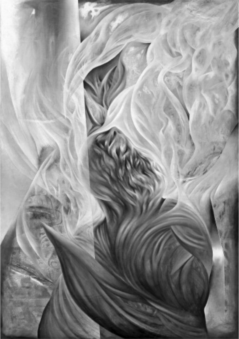
Oroszy Csaba: Nagyvárosi apostol