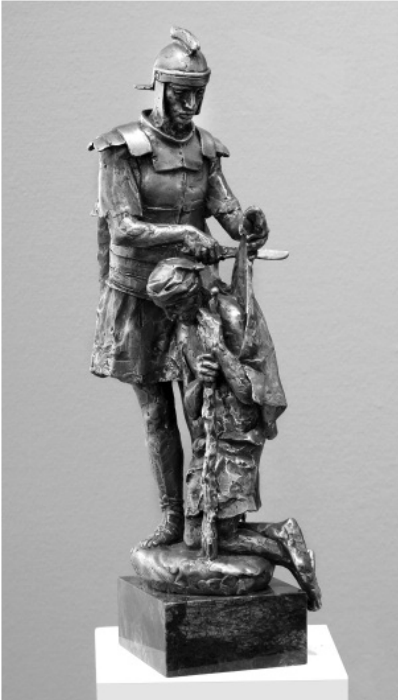
Farkas Ferenc: Szent Márton és a koldus