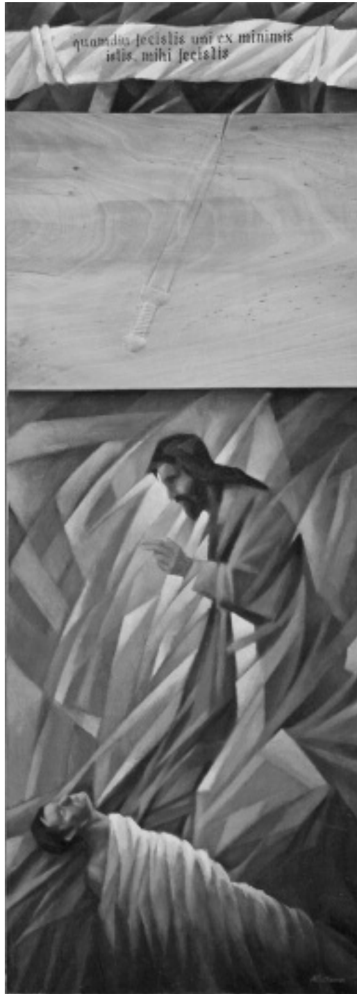
Katona József István: Szent Márton álma