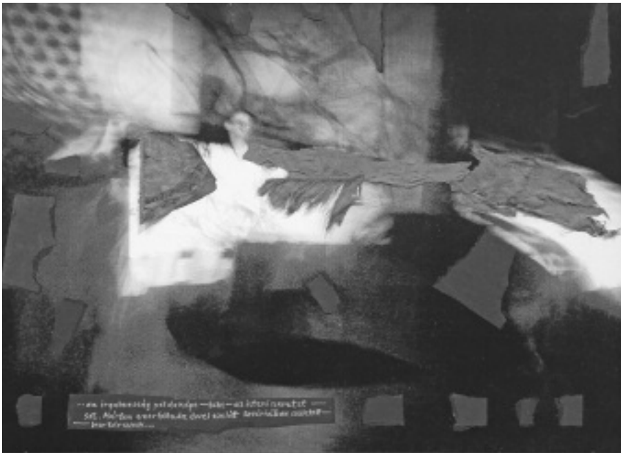
Polgár Csaba György: Szent Márton II.

Érdemes volt az újra kiadásra. Az újraolvasásra. És emlékezte megőrzésére. Kor-dokumentum és prózaírói remeklés egyszerre.