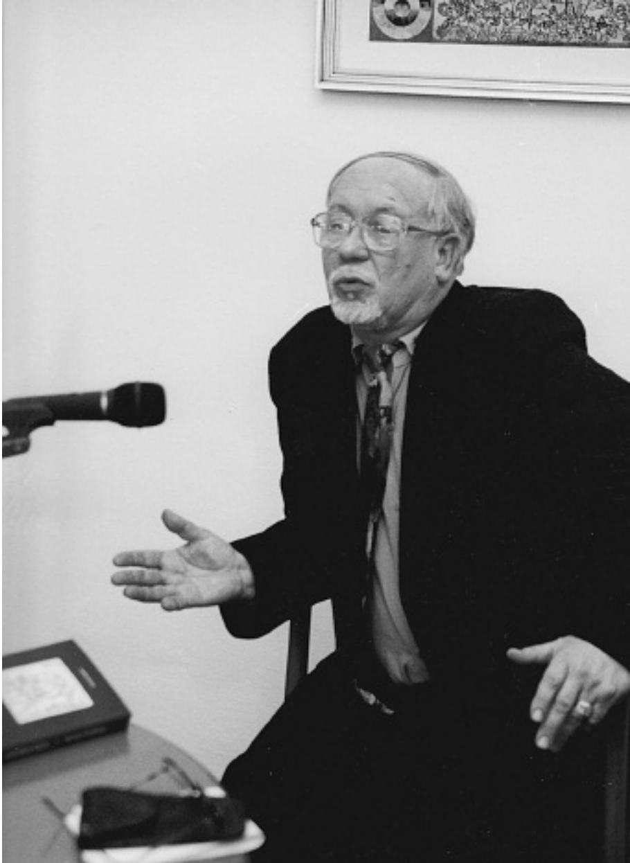
Szepesi Attila (1942–2017)