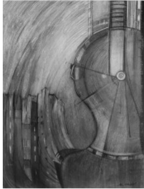
Ale Ildikó munkái

önmagához, egy olyan pályabér reményében, aminek egyetlen értelme-értedeme maga a célbajutás. És még mindig nem vagyunk a végénél. Ez a Taruszi aláírású szakasz a regény címe és főszövege között kapott helyet: tehát a szerzői narratíva része. És ahogy csukom be a könyvet, szemem ráesik a „kiadói fülszövegre” – ez macskakör-mök közötti testes egyenes idézet, jöllehet a hagyományos verstagolás nélkül. „Saulus pedig pusztítja vala az Anyaszentegyházat... Ap. Csel. 8. 3-. Így kezdődik, de aztán... visszaugrik a szöveg minden jelzés nélkül István vértanúságához, ahol Saul, mint a gyilkosok felsőruháinak őrizője bukkan elő a szent szövegben, aztán mit se törődve Fileppel (meg az Ézsaiást megérteni nem bíró „szerecsen komornyikkal”, akit valaha mint hermeneutikai jelképet, egyik könyvem címében bátorkodtam elhelyezni) s már úton vagyunk Damaszkuszba... Teljes az összevisszaság, se én, se más nem vette észre (tudtommal) az elmúlt félszázadban, ám Jézus nevének leírása – pontosan emlékszem – még így is provokáció volt akkor. Azután eltelik több évtized és egy ifjú költő, Térey János , ki másról ír, és mi mást, mint „verses regényt” – mint Saulusról? (Előtte meg misztériumot Jeremiásról...) És emlékszik-e még valaki Tandori Dezsőtől A damaszkuszi út című költeményre? Idézzük az egészet: „Most, mikor ugyanúgy, mint mindig, / legfőbb ideje, hogy”.