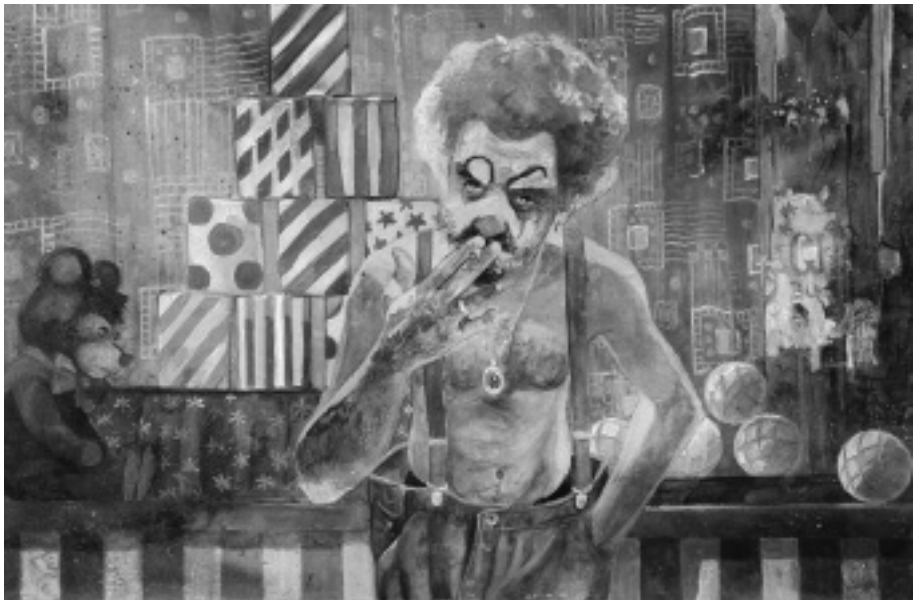
Ferkovics József munkái