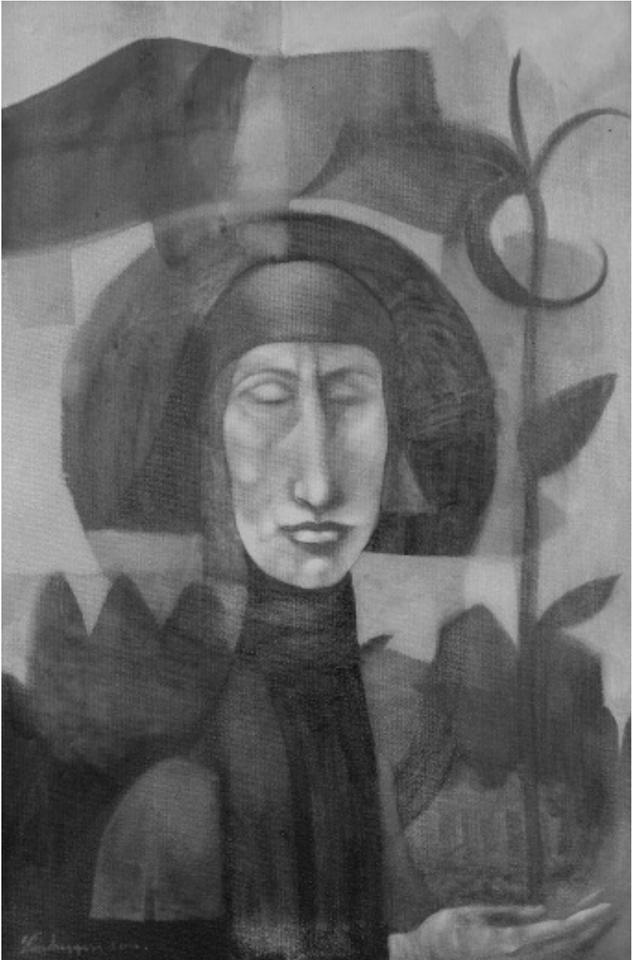
Kumbegyesi Ferenc munkája