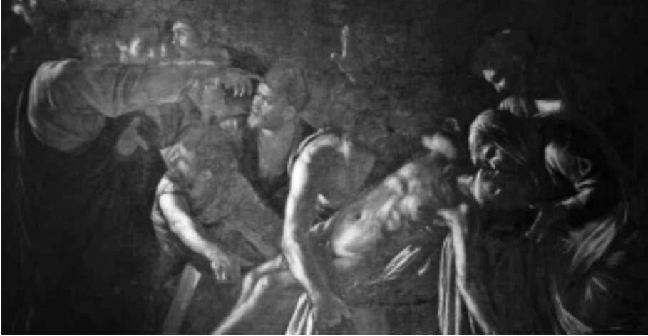
Caravaggio: Lázár feltámasztása.

A halottak nem támadnak fel. Nincs olyan erő, és nincs az a képzelet, bár Gilgames óta erőlködünk, hátha. Fohászokodom, és közben mormolom, hogy hallotta Aruru, amint Anu kívánta, elgondolt egy lényt elméjében, megmosta kezét, vett az agyagból, nyálával összesodorta, harcos Ninibtől lelket és vért is kapott; testet formázott, emberi testet.