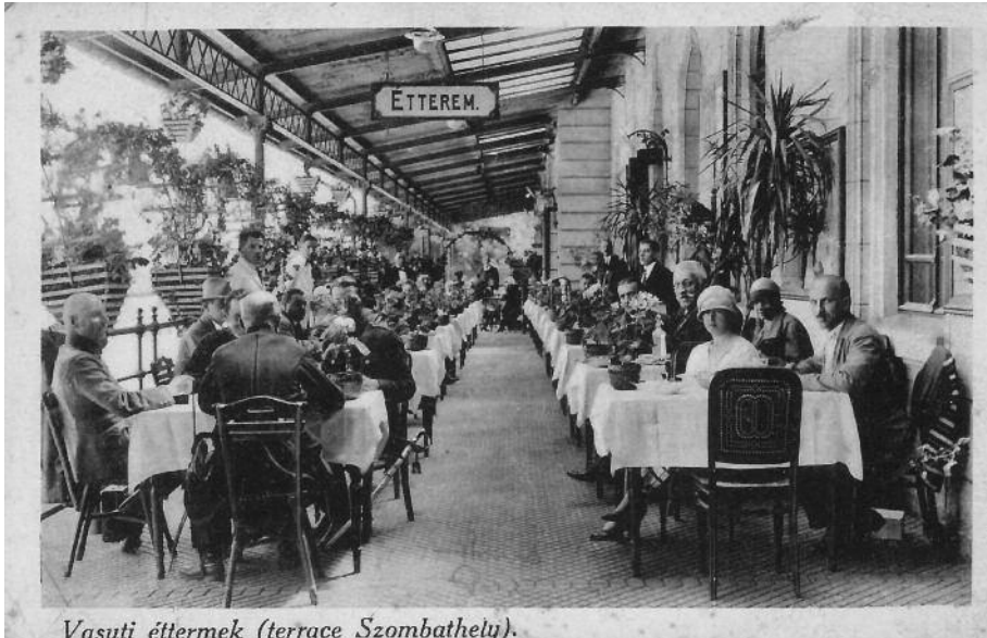
Vasúti étterem (terrace Szombathely).