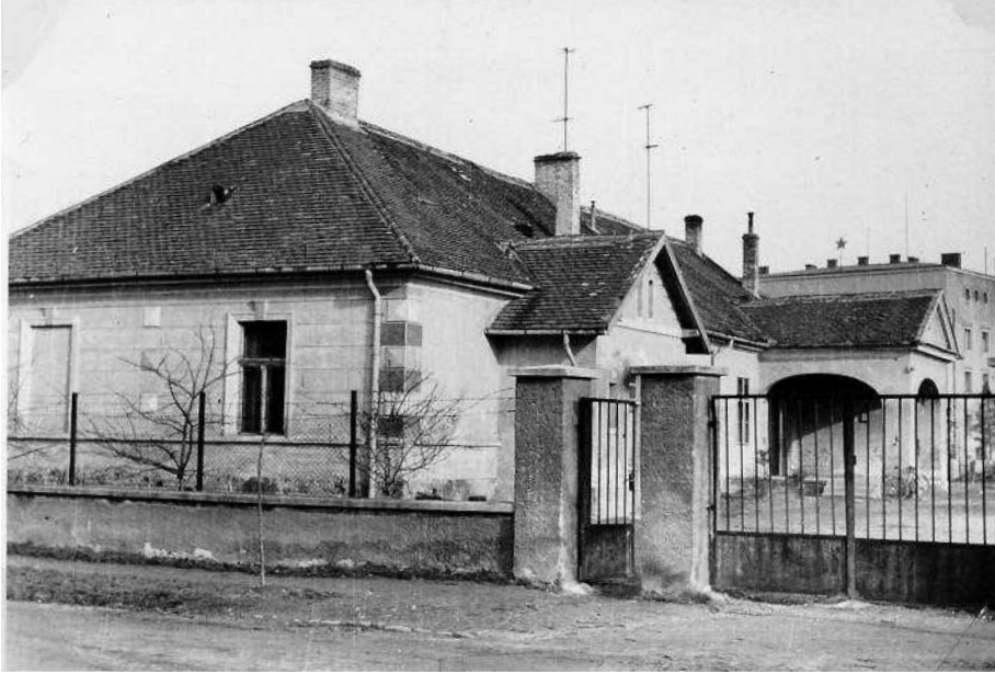
Régi vendéglő bontása a Magyar László utcában