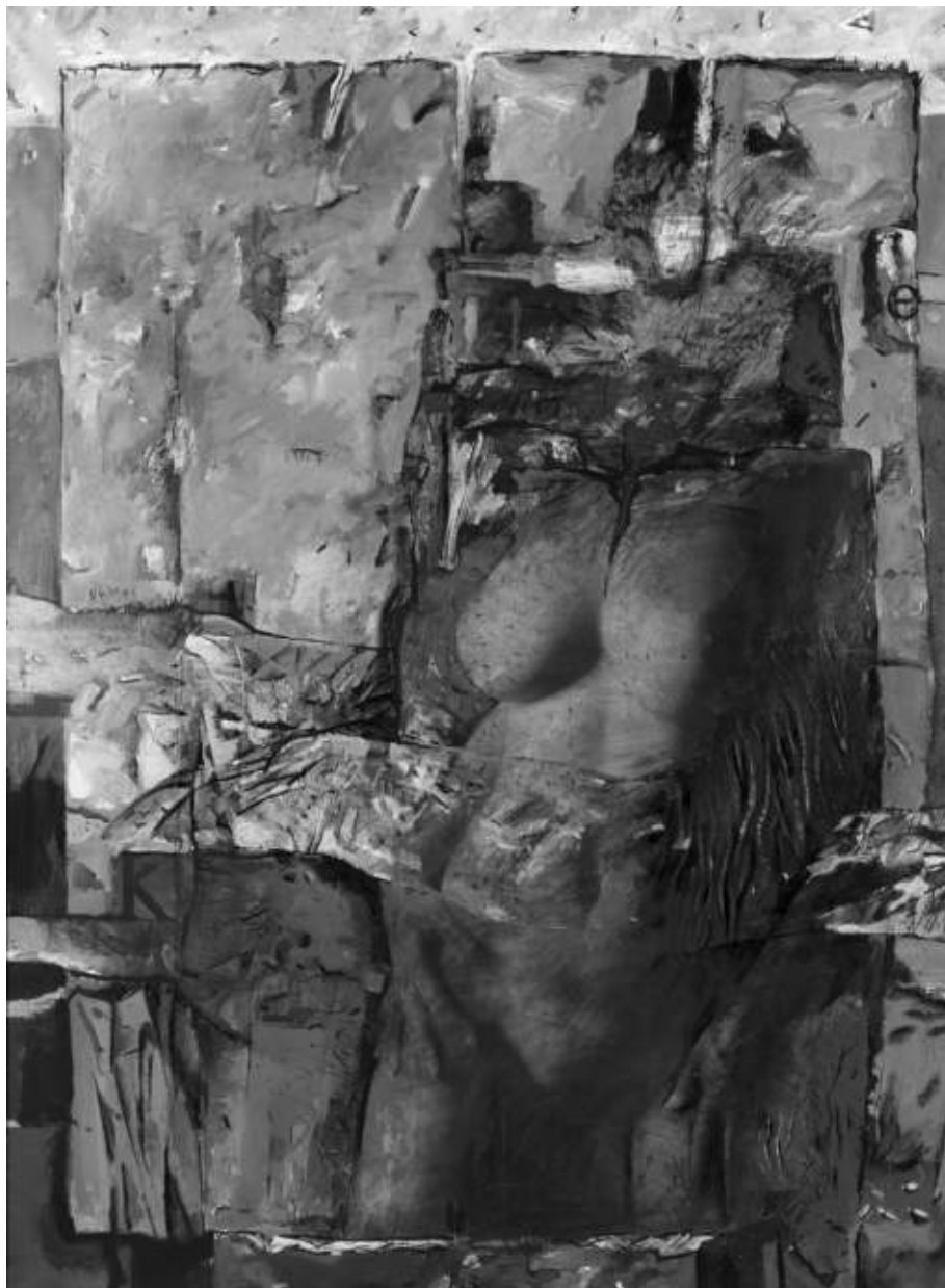
Nemes László: A szerelem átélése (2010)