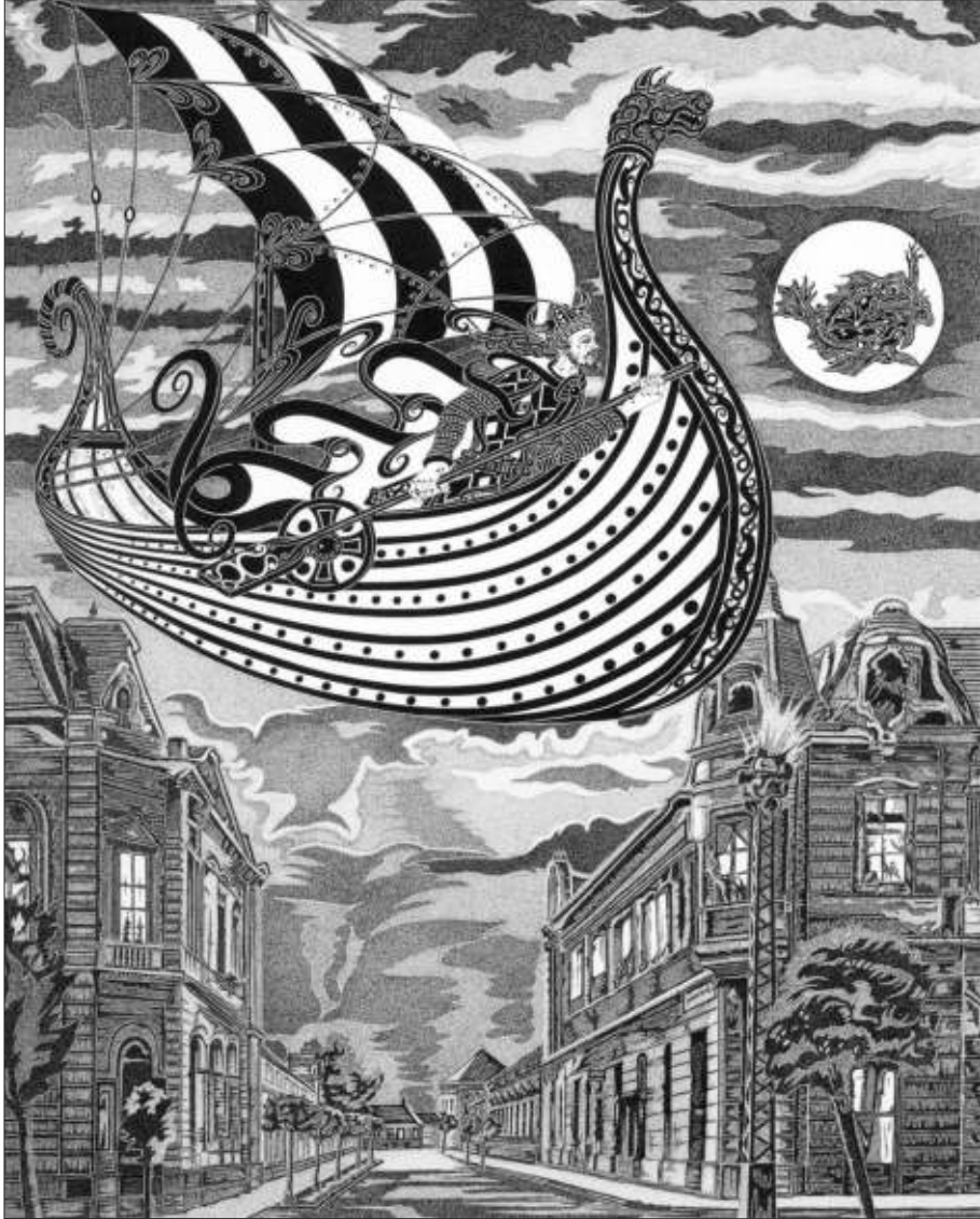
Németh Miklós: Viking saga (2012)