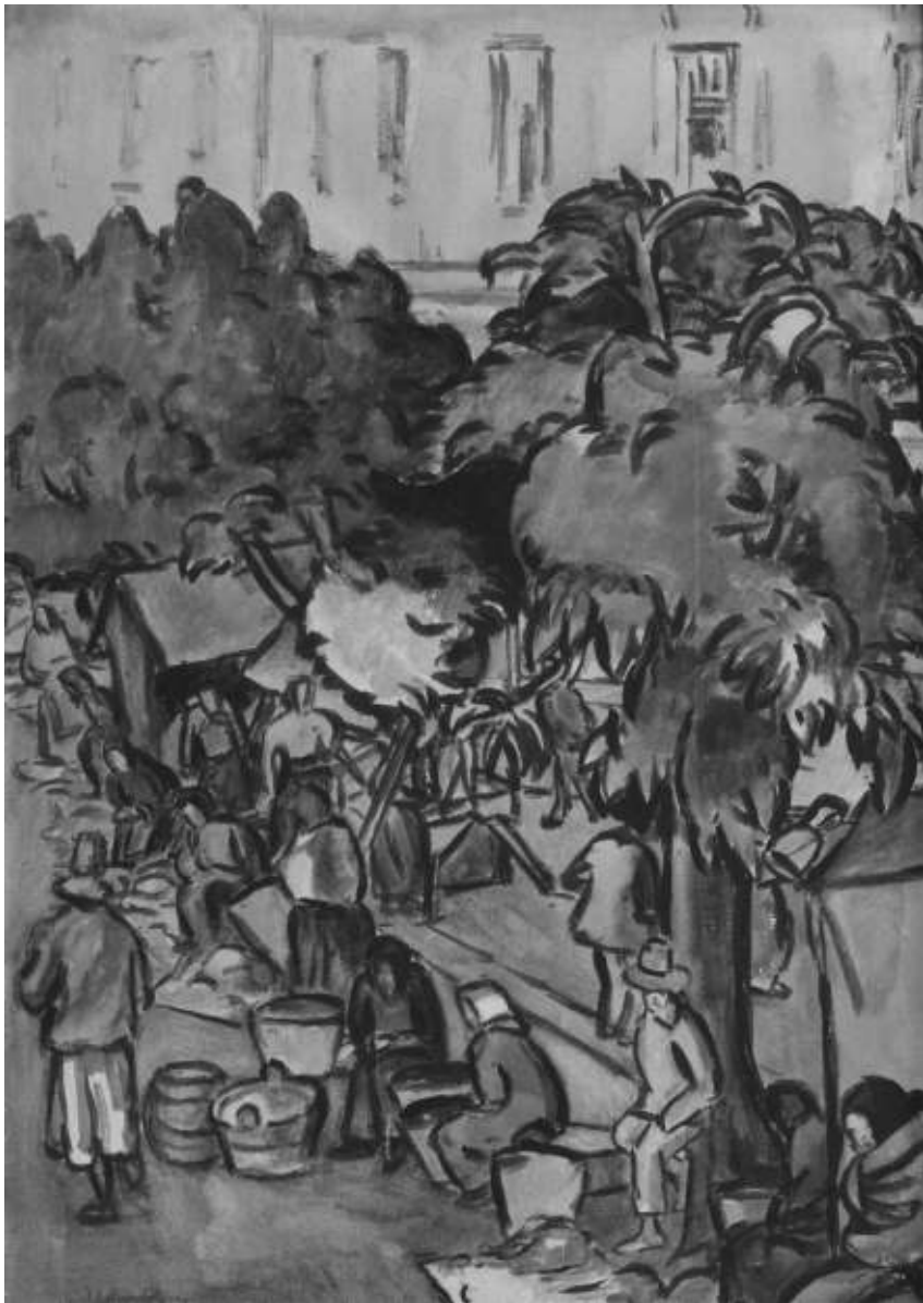
Udvardy Ignác: Vásári jelenet Nagybányán (1930 körül)