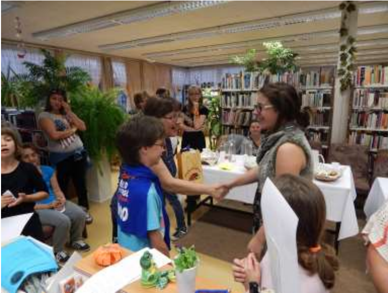
A 2. helyezett csapat átveszi a díjakat.

A legnagyobb sikert a könyvek aratták, mindenki tudott ízlésének, érdeklődésének megfelelő választani. Kb. 75 fő vett részt a programon, ami levezette az egész napi ténykedést.