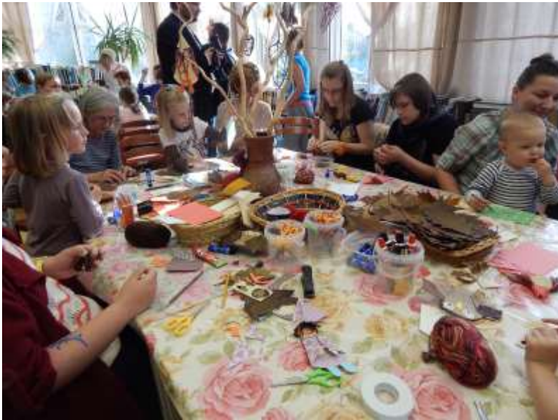
Karon ülőtől a nagymamáig mindenki ügyeskedett.

Az őszi játszóház már hagyományos programja a Könyves Vasárnap rendezvényeinek. Pici óvodásoktól nagyszülőkhöz minden korosztály képviseltette magát az eseményen. Együtt ügyeskedtek és készítették el a szebbnél szebb műveket: eső manócskát, varjút, baglyot, pókhálót készíthettek a bütykölők. A másfél óra nem is volt elég, kicsit ráhúztunk még, hogy mindenki minden művét befejezhesse. Kb. 60 fő vett részt a programon minden korosztályból.