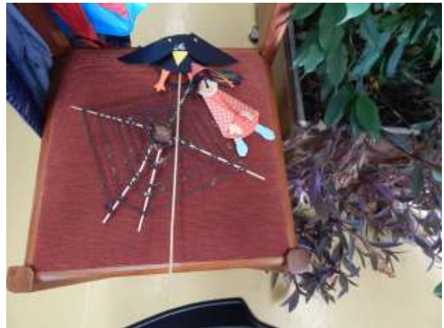
Pókháló és varjú.