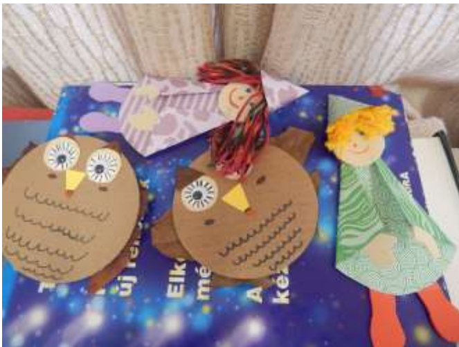
Baglyok és eső manócskák.