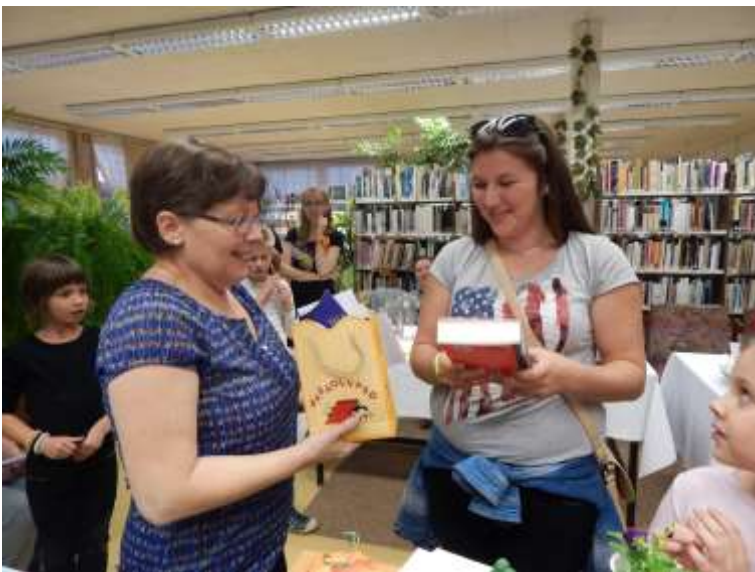
Az 1. helyezett csapat átveszi díját.