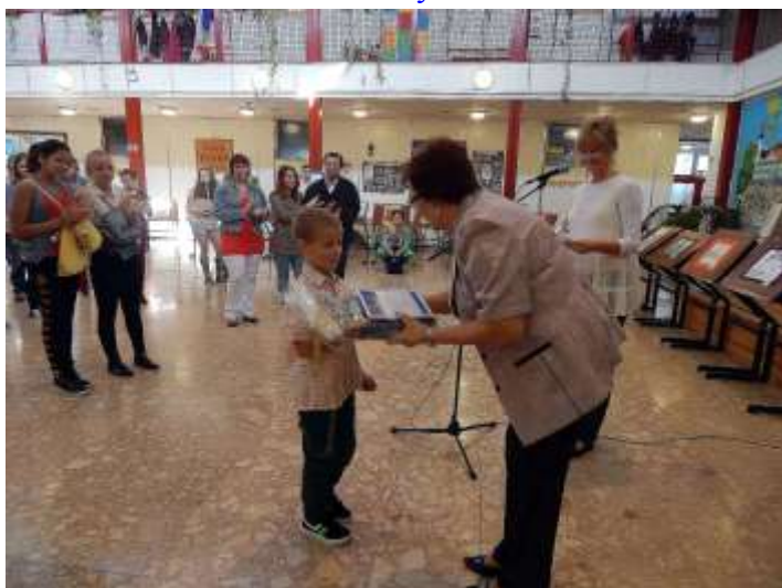
A díjak átadása